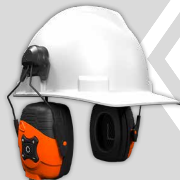
IT70 mit Helmhalterung