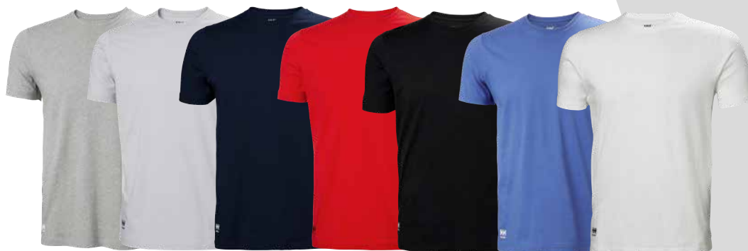
[GRM] [HGR] [M] [R] [S] [STB] [W]