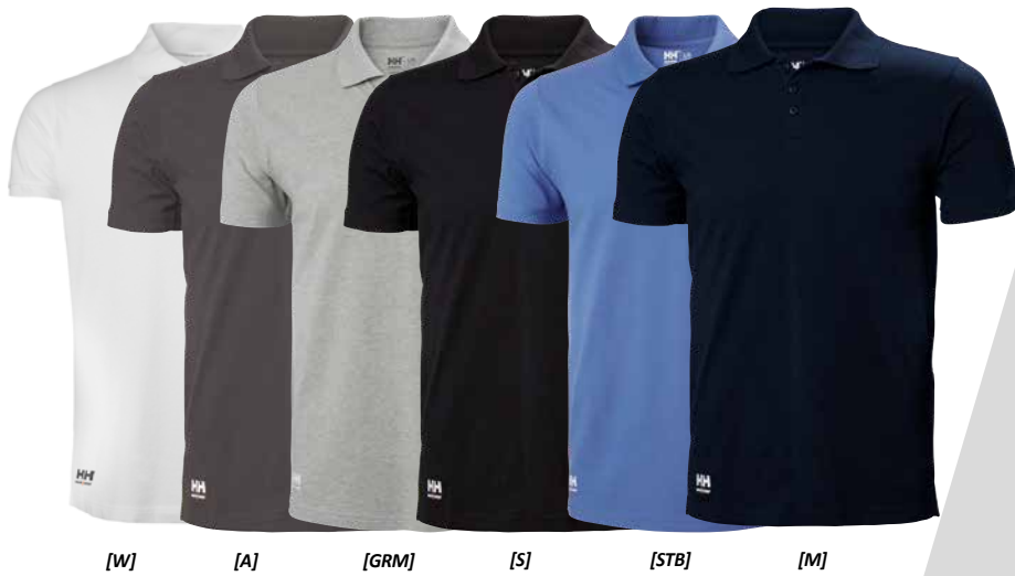
[W] [A] [GRM] [S] [STB] [M]